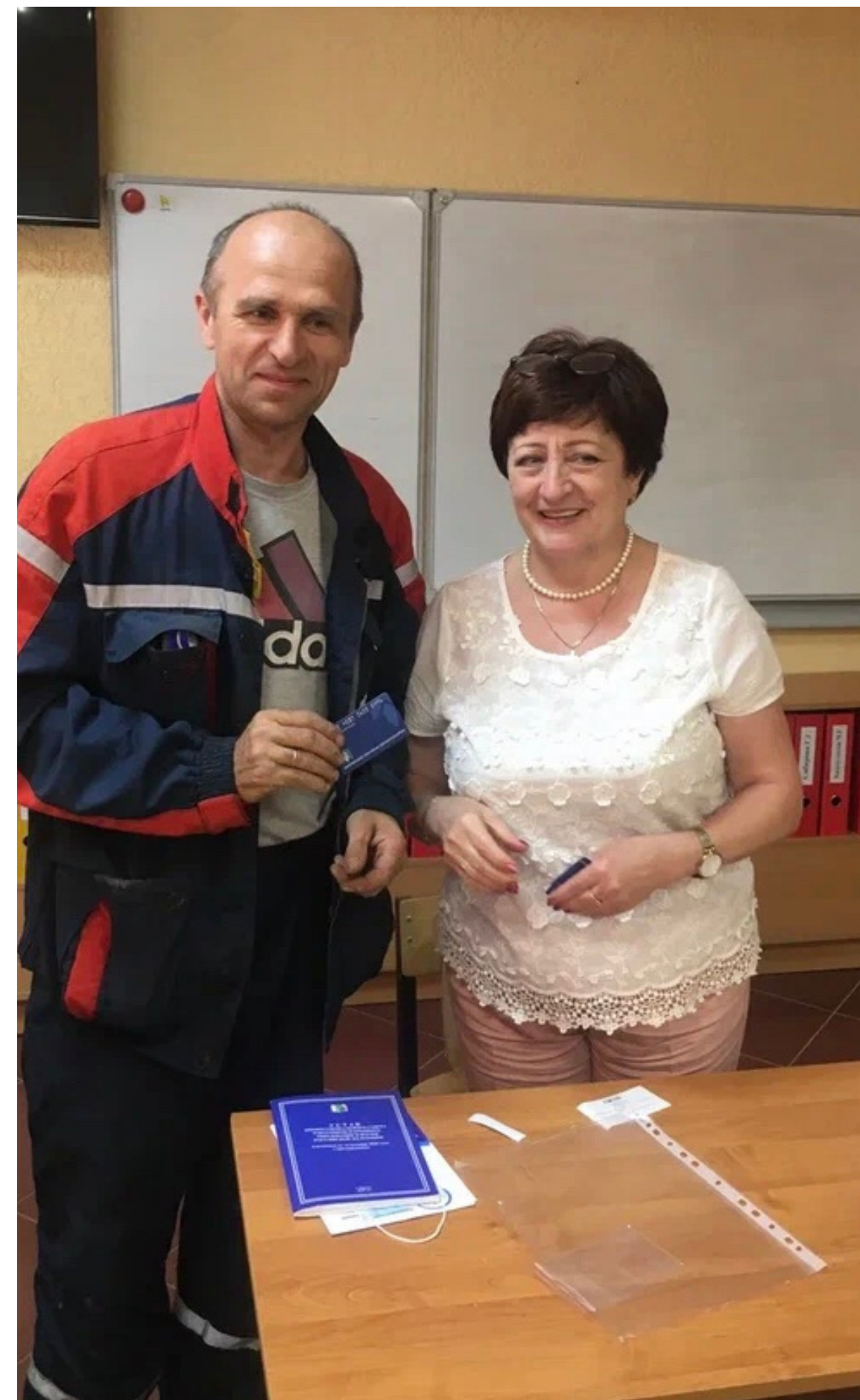
Гусевский политехнический техникум