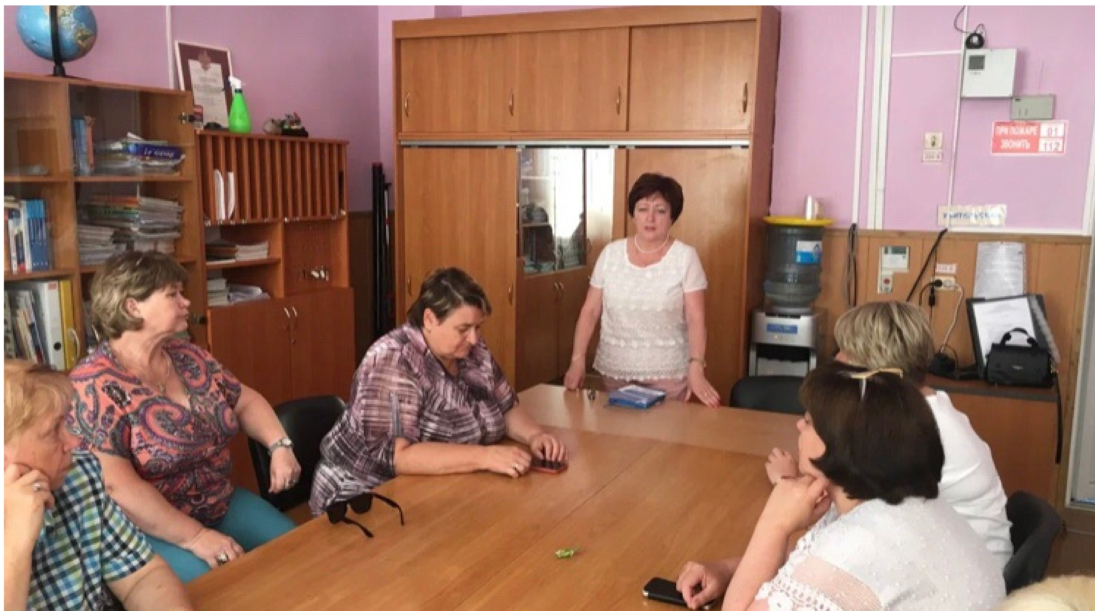
Черняховский район, п. Междуречье