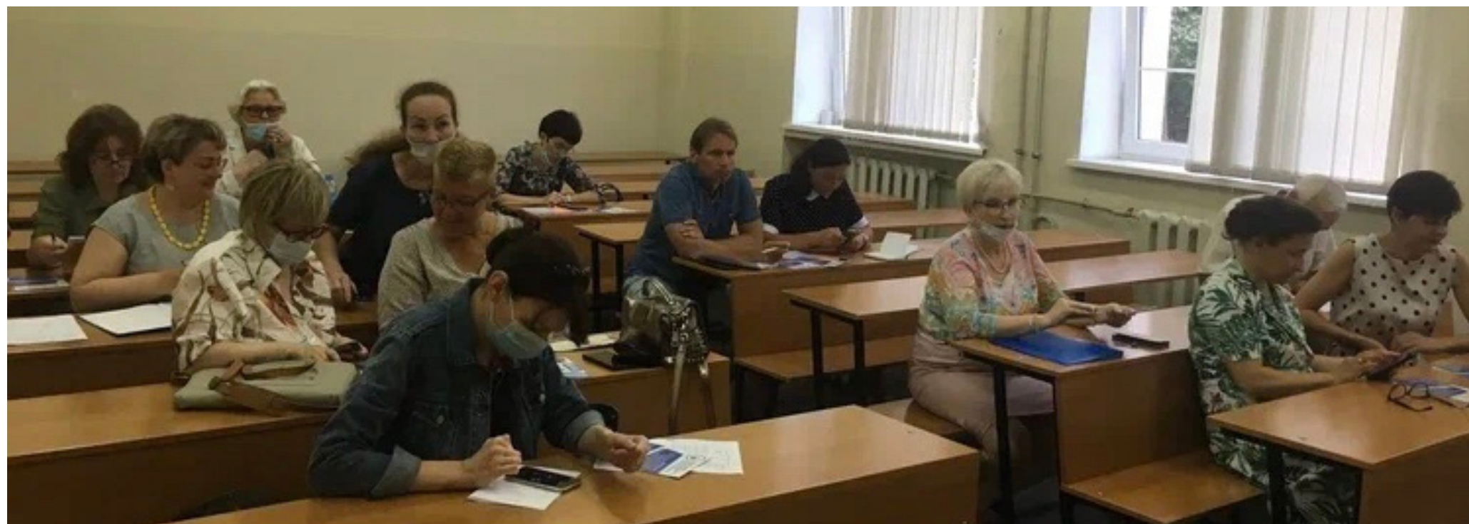
БФУ им. И. Канта, институт образования