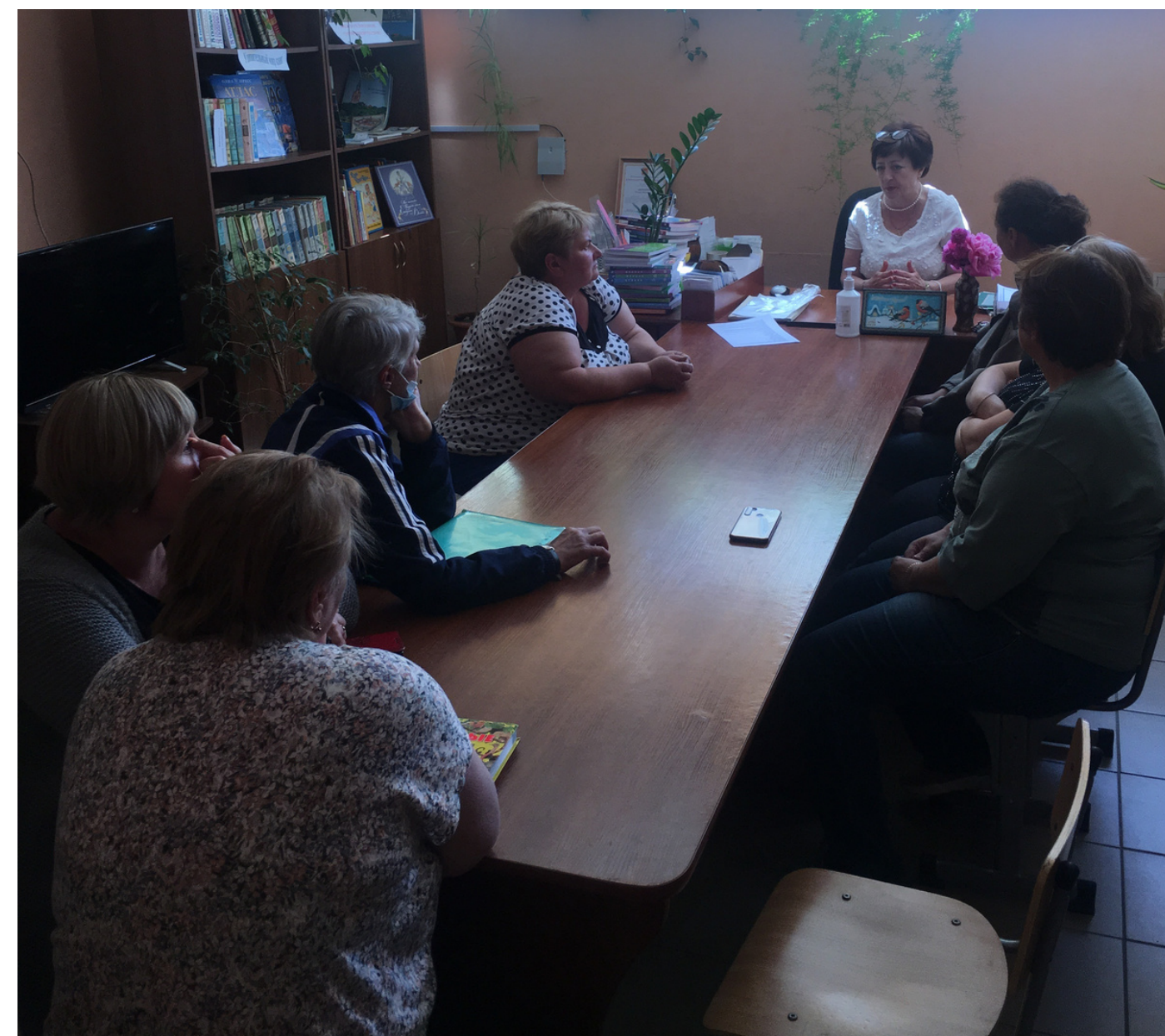
Озёрский район п. Ново-Гурьевское