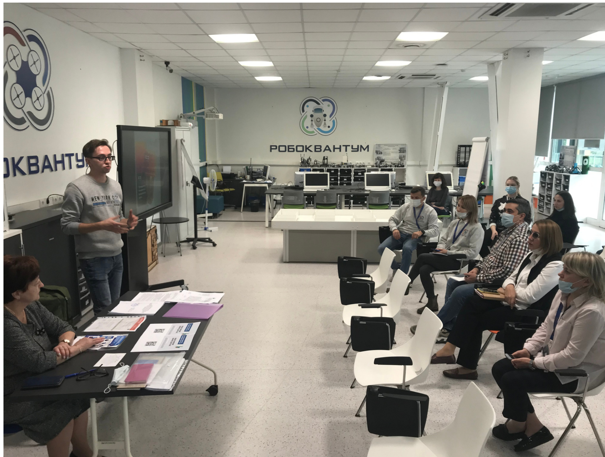
Профсоюзное собрание в Кванториуме