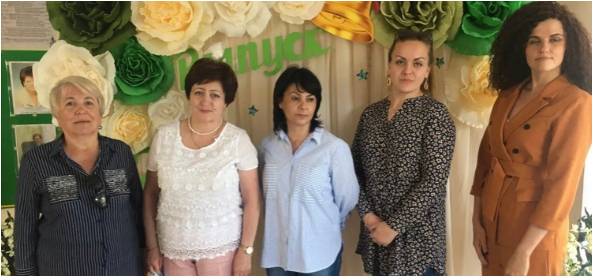
Озёрский район, п. Ушаково