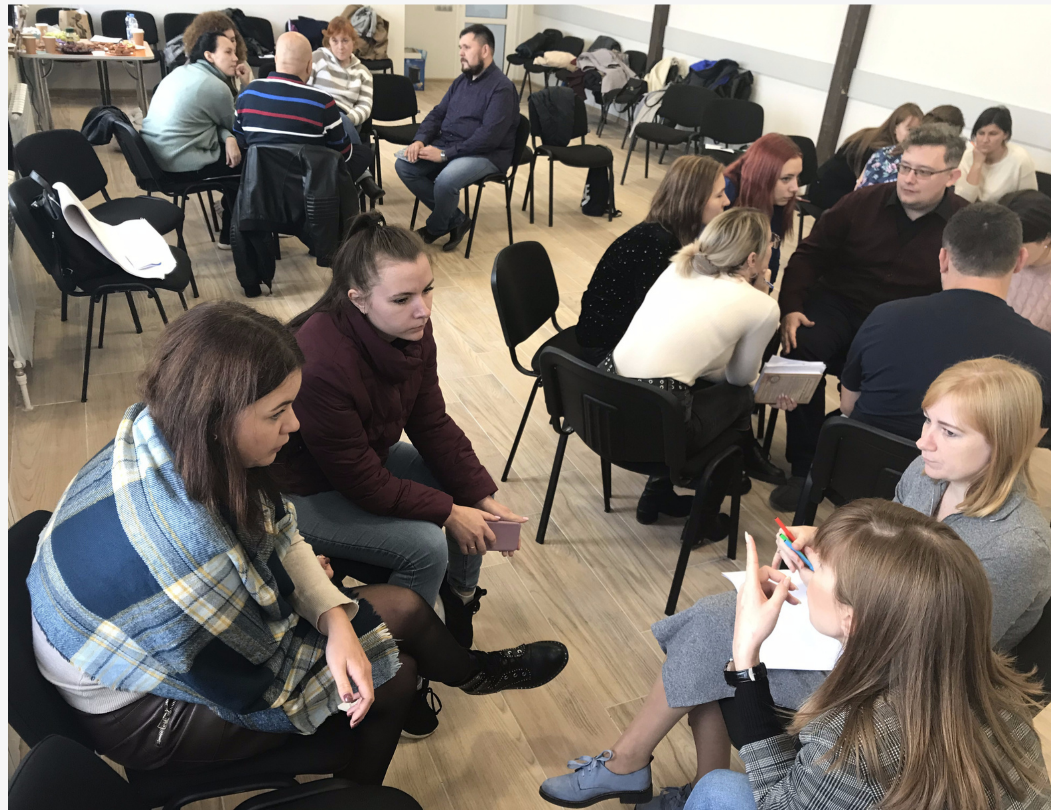
Заседание Совета молодых педагогов, г. Зеленоградск