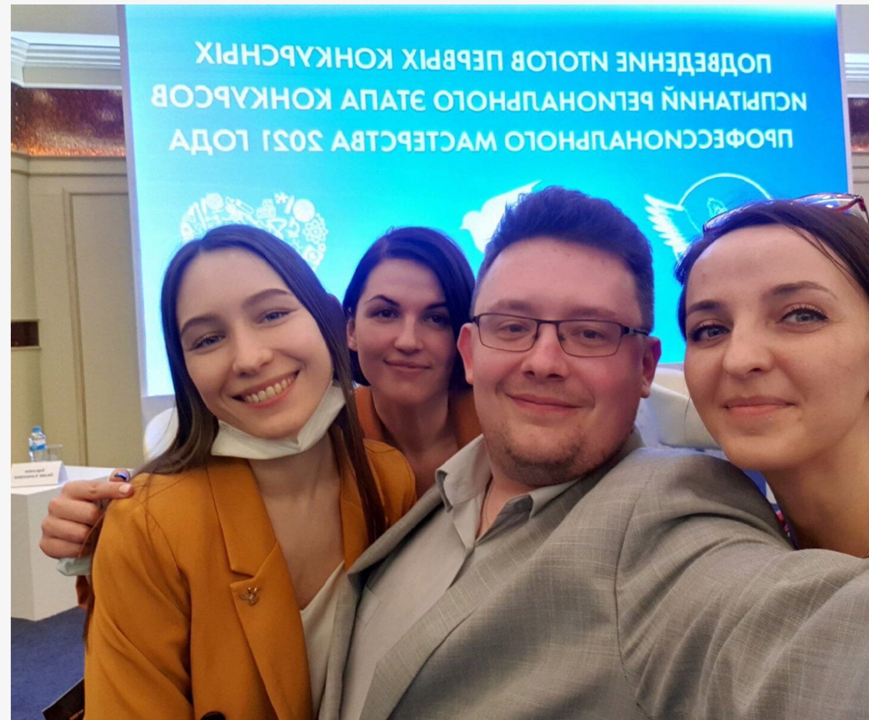
Панельная дискуссия "Работа педагога: не только обучать, но и воспитывать"