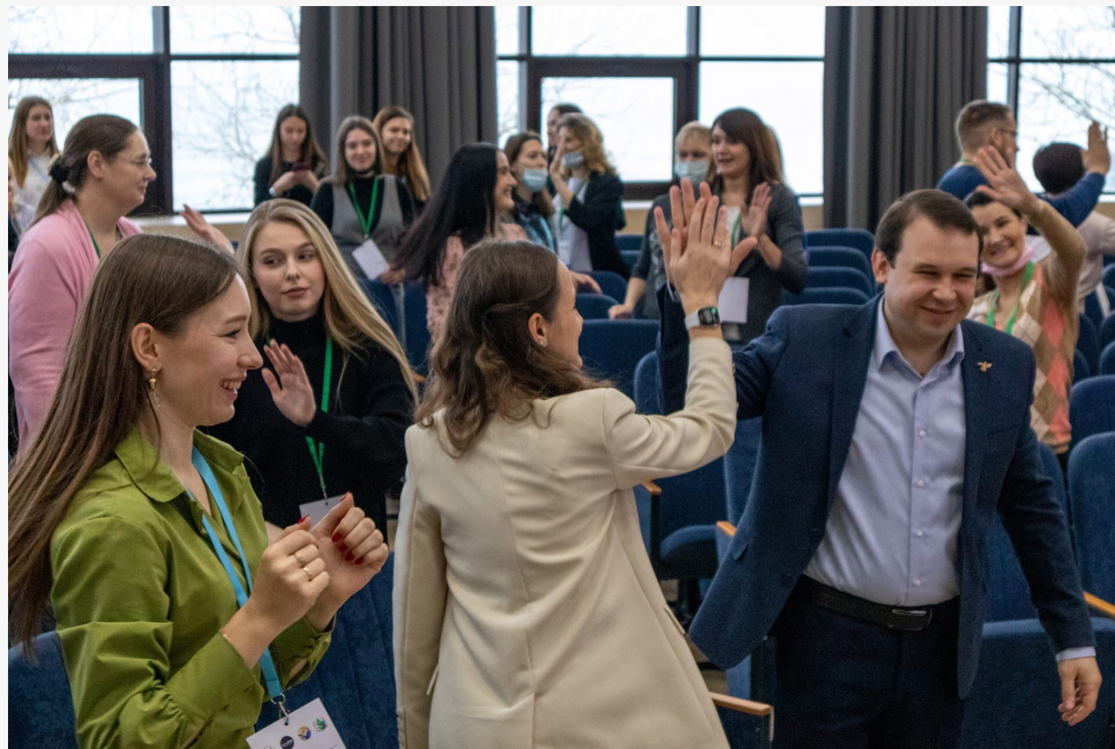
Эдьютон «Путь к успеху: Янтарный пеликан готовит победителей», г. Зеленоградск