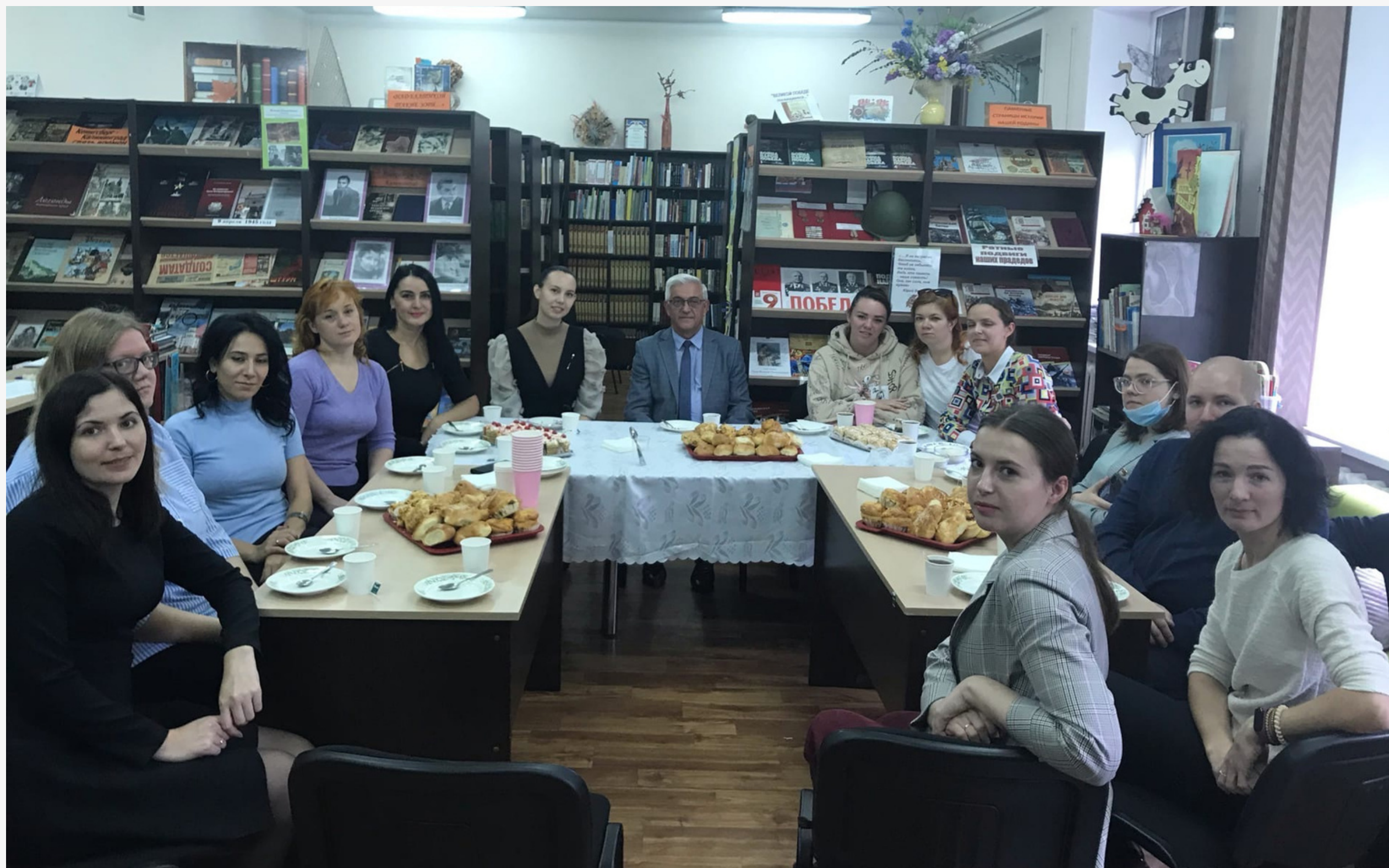
Создание Совета молодых педагогов в МАОУ СОШ №12 г.Калининграда